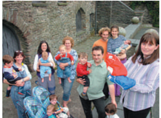
Rhieni yn trafod eu profiadau gyda Chlytiau Go lawn

Yn ôl y disgwyl bu rhai problemau, er enghraifft, maint y clytiau ar fabanod newydd-anedig, neu problemau wrth